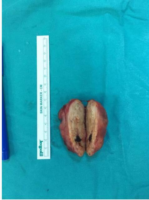
Şekil 2A : Cerrahi sırasında çıkarılan kitle