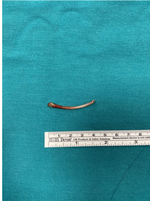
Şekil 3 : Mikrolaringoskopik olarak bütünlüğü bozulmadan çıkarılan yabancı cisim(tavuk kemiği)

Uygun açılı laringeal forceps ile kemik çevre dokular korunarak çıkarıldı (Şekil 3).