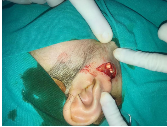
Şekil 1A : Kitlenin peroperatif görünümü

Histopatolojik incelemede 3x2x1.5 cm boyutlarında, lobüle konturlu, tamamı kalsifiye, sarı beyaz renkli operasyon materyali deklasifiye edilerek pilomatrikoma (kalsifiye epitelyoma) tanısı konuldu.